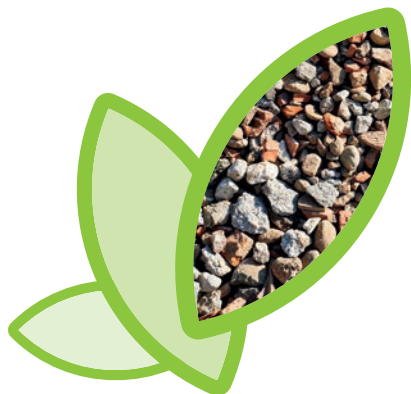
Frantumato MPS 0/63

Gli aggregati riciclati prodotti dalle attività di trattamento meccanico sono: