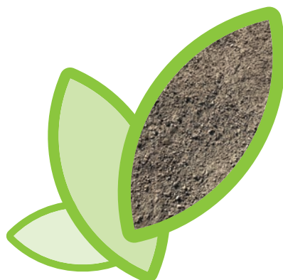
Sabbione MPS 0/14

Entrambi i materiali soddisfano i requisiti previsti sia dal D.M. n. 186 del 05/04/2006 (Allegato 3), che ne sancisce la cessazione di qualifica di rifiuto, sia dalla Circolare n. 5205 del 15/07/2005 (G.U. n. 171 del 15/07/2005), che ne detta le specifiche fisico-meccaniche al termine del processo di recupero.